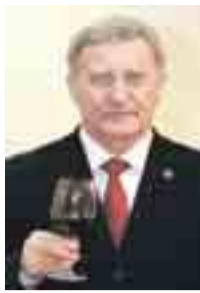
Agust Ensesa Bonet Escola de Tastavins del Gironès

V i negre empordanès de bona qualitat elaborat a Vilajuïga pel celler Espelt Viticultors. Color robí molt atractiu, amb aroma potent que recorda la fruita madura amb notes de torrats i d'espècies dolces. En boca és suau i vellutat. Saborós i amb tanins madurs i ben equilibrats. Està elaborat amb la varietat empordanesa Samsó i també amb Cabernet Sauvignon, que li aporta estructura i modernitat.