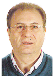
Xavier Romero www.catalunya-postal.cat

L'exposició filatèlica commemora el centenari del primer vol