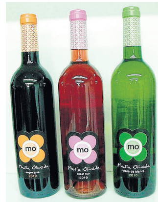
Garriguella i Capmany. Per a més informació: www.grupoliveda.com i www.girovi.cat .

lor molt intens amb una concentració d'aromes primàries procedents del raïm. És un vi delicat i fresc. En boca és pletòric de carnositat. Saborós, elegant, amb tanins fàcils i sedosos. Està elaborat amb Garnatxa negra i Cabernet Sauvignon. Excel·lent preu de venda de 3,5 euros. Presentació moderna. També s'elabora en rosat i blanc, d'igual qualitat i preu. En la seva versió criança ha estat escollit pel